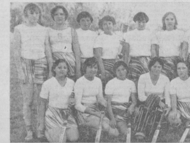
НА СНИМКЕ: команда Сабир-Рахимовского района — чемпион XV городской спартакиады.