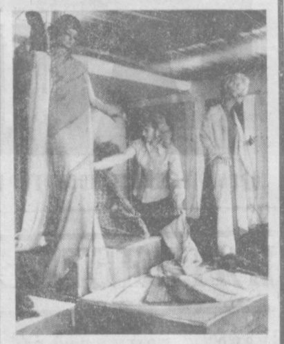
ПНР. Изделия вадзинской фабрики «Факс» — тель и кружева — пользуются широкой известностью не только в Польше, но и за рубежом. Сделанные из стилона, торлена, вискозы, они не раз экспонировались на выставках и награждались медалями. НА СНИМКЕ: продукция фабрики «Факс».