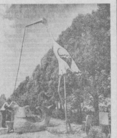
УКРАИНСКАЯ ССР. Приветливо встречают путника на трассах Буковины стилизованные, красочные оформленные колоды.

Жители шведского города Ландсбоден предложили властям переименовать город в Таулингстад, что означает Город близнецов. В Ландсбодене чаще, чем в каком-либо другом месте в мире, рождаются близнецы. Ученые до сих пор не могут установить причину этого удивительного феномена.