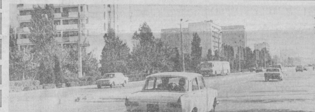
КИРОВСКИЙ РАЙОН. Микрорайон Ц.5 на проспекте Ленина.