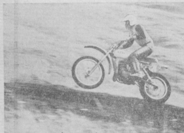
На дистанции моторосса.

Несмотря на то, что на улице осень и дни стали короче, не перестают звенеть голоса на спортивных площадках ЖЭН-28, что на массиве Черданцева-1. После школы, выучив уроки, ребята спешат на занятия в секции футбола, волейбола, настольного тенниса, хоккея. Недавно спортивные секции приняли новое пополнение. Созданы еще 2 футбольные и волейбольные команды. На собраниях ребята познакомились с планами тренировок, расписанием занятий, прослушали информацию о предстоящих соревнованиях. Сейчас во всех секциях идет подготовка к предстоящим соревнованиям по сдаче норм комплекса ГТО. В. ИВАНОВ.