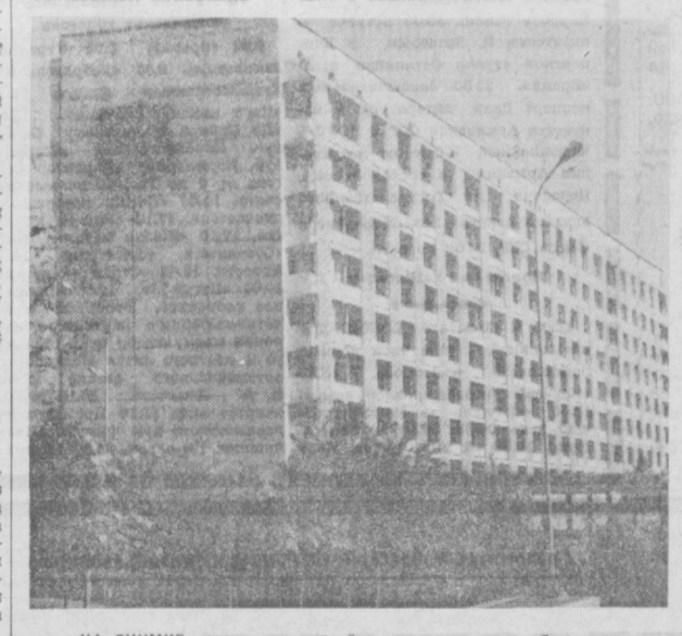
НА СНИМКЕ: институт грудной и экспериментальной хирургии.