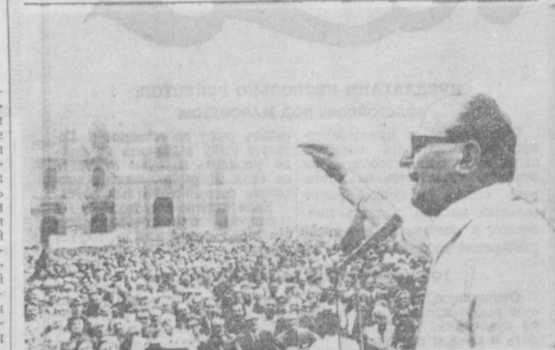
ИТАЛИЯ. Тысячи пенсионеров приняли участие в массовой манифестации протеста против роста дорожных, за улучшение системы социального обеспечения, состоявшейся в Милане. Они потребовали от властей немедленно принять меры по улучшению своего положения и увеличению пенсий. Манифестация была приурочена к проходящим сейчас переговорам между правительством и профсоюзами относительно реформы нынешней системы социального обеспечения. НА СНИМКЕ: во время митинга.

Во время следствия все компрометирующие чернорубашечника документы неопытные нефашисты «исчезли». Полиция, в которого собралась стрельба нефашиста, был соответственно «обработана» в результате заявил, что ему все «показалось». Адвокат «доказал», что Абрианди совершил преступление, потому что ему угрожал. Газета итальянских коммунистов «Унига» подчеркивает, что это далеко не первый в подобном случае попустительская нефашистскими преступлениями.