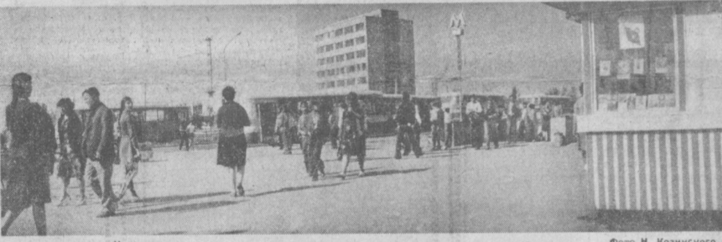
У станции метро «Чиланзар».

В свое время американо-советский президент под влиянием волны режис