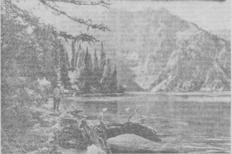
На озере Сарычелек. ТВОРЧЕСТВО НАШИХ ЧИТАТЕЛЕЙ.

А ГДЕ ПАРКЕТ? Этот простой вопрос будучи жильцом дома № 44 на массиве «Ташавтомаш-4» последние время часто адресуя строителям СУ-7 Ташкентского домостроительного комбината № 1. И, надо сказать, задают его не без оснований. Ведь проектировщики предусмотрели в новой серии домов «ТашДСК-75А» установку паркетных полов. А вот в доме № 44 почему-то решили настелить обычные полы. Отделочники на наши вопросы отвечают: «Паркета нет. Где он, не знаем». Может быть, руководство строительно-ремонтной организации знает, где паркет? ЗИМАРЕВ, инженер.