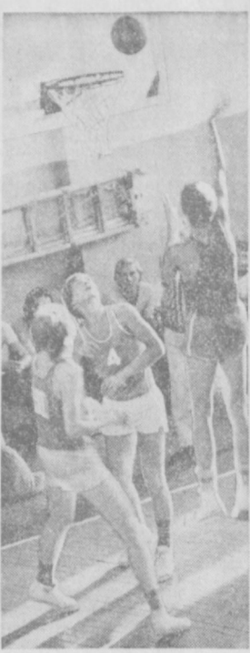
ИЗ СЕРИИ «МГНОВЕНИЯ СПОРТА». Баскетбол: мяч над польцом.

— В нашей группе, — продолжает И. Красильников, — люди самых различных возрастов. Занятия оздоровительной физкультурой стали для них потребностью. Наш девиз «Физкультура — сегодня и каждый день!».