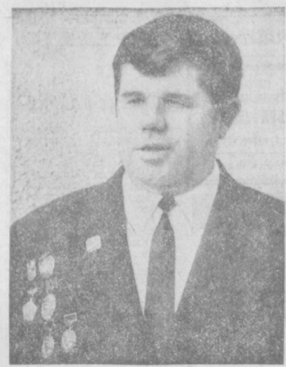
Работа у них такая ОБЫЧНЫЙ ДЕНЬ