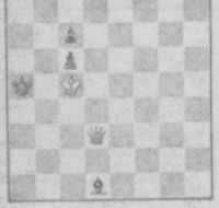
Под редакцией кандидата в мастера спорта Г. Барбойма.