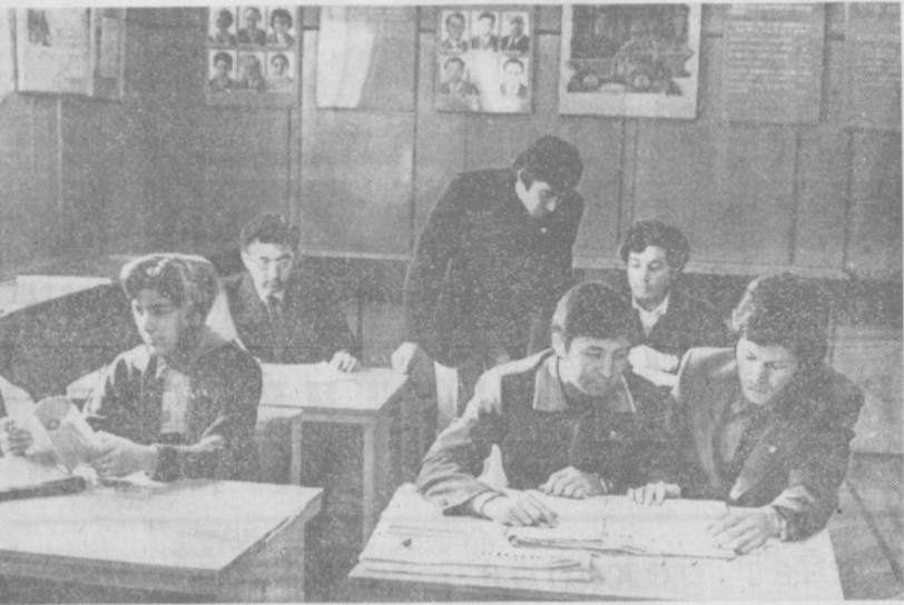
Всегда бывает многолюдно в кабинете политпросвещения Октябрьского района партии. НА СНИМКЕ: агитаторы и пропагандисты знакомятся с новой общественно-политической литературой, поступившей к началу учебного года.

Выполняя постановления ЦК КПСС «О работе партийных организаций Башкирии по усилению роли экономического образования трудящихся в повышении эффективности производства и качества работы в свете решений XXV съезда КПСС», совет по экономическому образованию добивается еще более тесной связи учебы с жизнью, с задачами трудового коллектива.