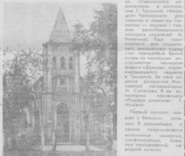
Долгое время здание кирхи перестало функционировать.