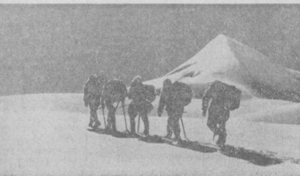
Путь к вершине.