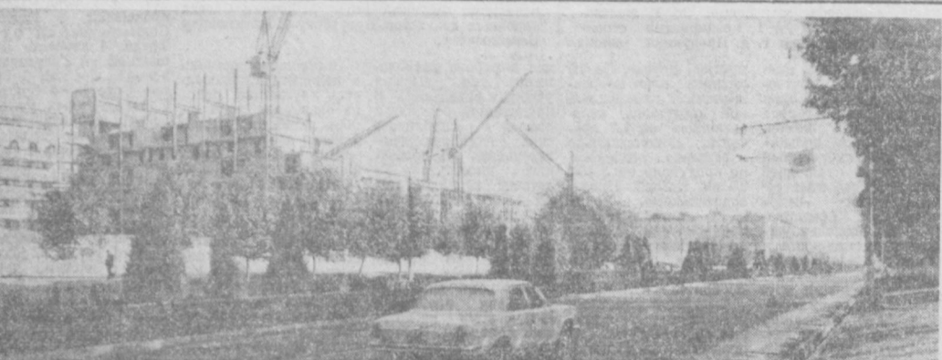
НА СНИМКЕ: в новостройках улица В. Хмельницкого.

вершенствуется производство, широко внедряются и новая техника. Совет НТО принимает активное участие в организации и проведении смотров-конкурсов скоростного монтажа, следит за ходом и подводит итоги социалистического соревнования рационализаторов. При этом особое внимание уделяется экономии металла за счет улучшения методов монтажа сантехнических систем, улучшения качества и других инженерно-экономических мероприятий со-