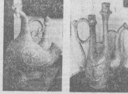
Р. ГУЛЯВОВА. НА СНИМКАХ: экспонаты музея.

Музей прикладного искусства Узбекистана экспонировался в Запорожье, Дагестане, во многих союзных республиках. Познакомился с его коллекцией и жители Швеции, ФРГ, Шри Ланки. «Этот музей как бы зеркало украинской души. Он является лучшим свидетельством того, что социализм бережно охраняет народное искусство, развивает его», — так написал в книге отзывов об экспозиции музея индийский писатель Навтедж Сингх.