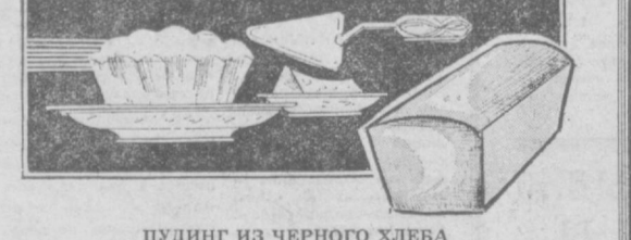
ПУДИНГ ИЗ ЧЕРНОГО ХЛЕБА

Рецептура: тертая булка — 1/2 стакана, яйца — 5 шт., молоко — 1/2 стакана, сметана — 1/4 стакана, сахар-песок — 1 стакан, яблоки — 0,5 кг, толченые сухари — 2 столовые ложки, масло — 50 г, корица или кардамон.