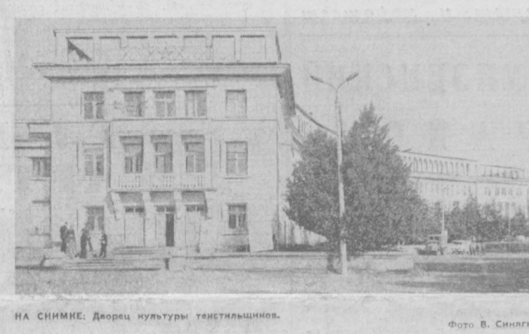
НА СНИМКЕ: Дворец культуры текстильщиков.