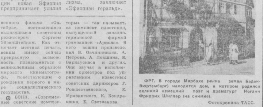
ФРГ. В городе Марбахе (ныне земля Баден-Вюртемберг) находится дом, в котором родился великий немецкий поэт и драматург Иоганн Фридрих Шиллер (на снимке).

УЛАН-БАТОР. Отряды международной геологической экспедиции, действующей на территории народной Монголии, успешно завершили третий полевой сезон, вернулись на центральную базу в Улан-Батор. Из целого ряда ранее обнаруженных рудопроизводящих месторождений, которыми богата республика, выделены наиболее интересные, на взгляд специалистов, для дальнейшей работы.