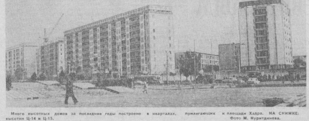
Много высотных домов за последние годы построено в кварталах, прилегающих к площади Хадра. НА СНИМКЕ: Фото М. Нуриддинова.

ОТКРЫТИЕ НЕДЕЛИ ДРУЖБЫ МОЛОДЕЖИ ИНДИИ И СССР. Тепло и радушно встретили столица Узбекистана участники Недели дружбы советской и индийской молодежи. В Ташкентском аэропорту сразу по приезде индийской делегации из Дели состоялся митинг. Гости побывали в Ташкентском филиале Центрального музея В. И. Ленина, в ВДНХ Узбекской ССР, в Музее истории комсомола республики. Разнообразная программа Недели Дружбы. В эти дни пройдут заседания семинара, митинги, встречи с комсомольскими активистами республики, с активистами Узбекского отделения Общества советско-индийской дружбы. (УТАП).