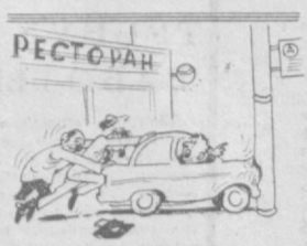
Поднажимь, ребята, сейчас она заведется! Рис. Ю. Бродяцкого.

По совету монтевизинских психологов, работающих над решением этой проблемы, в ближайшее время наметается выпуск для этой категории водителей специальных очков, ограничивающих обзор.