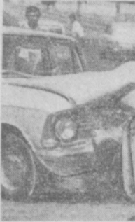
Результат еще одной поездки за рулем под хмельком.