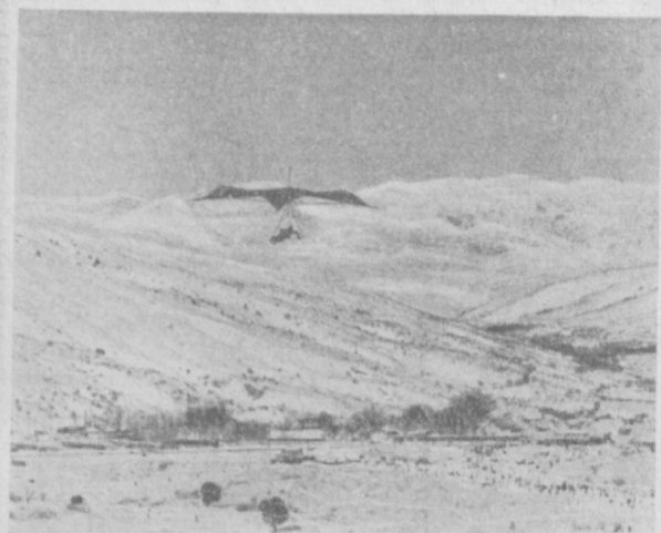
В Чимган пришла зима. И вновь парят над заснеженными склонами чудо-птицы — дельтапаланы.