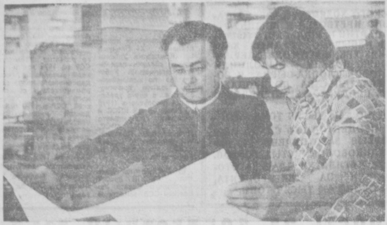
Рассказы о коммунистах