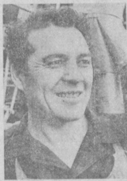
БЛАГОДАРЯ осуществленной реконструкции предприятия, постоянно

слесарь-жестянщик «Ташсельмаша», член Центральной ревизионной комиссии КПСС