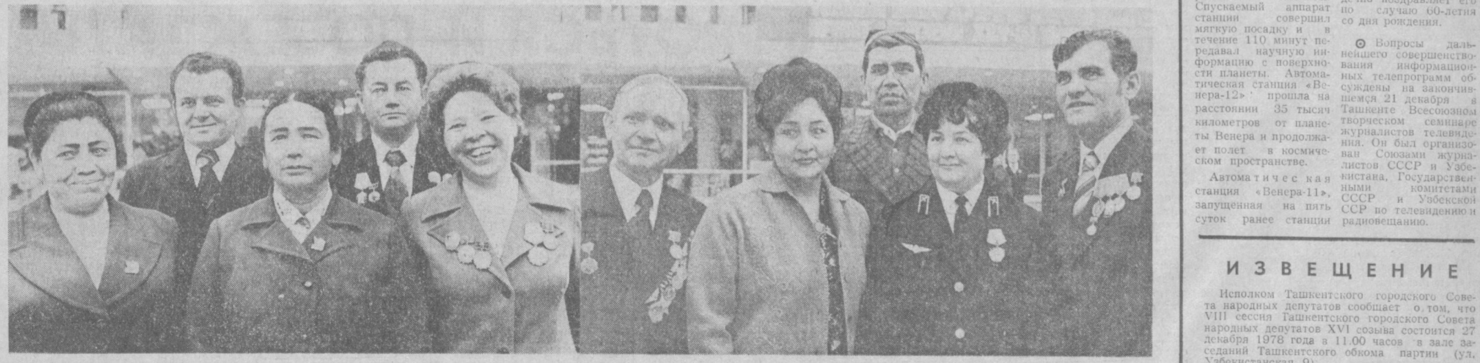
НА СНИМКЕ: группа делегатов XXII Ташкентской городской партийной конференции.

Регистрация депутатов будет производиться там же с 10.00 часов.