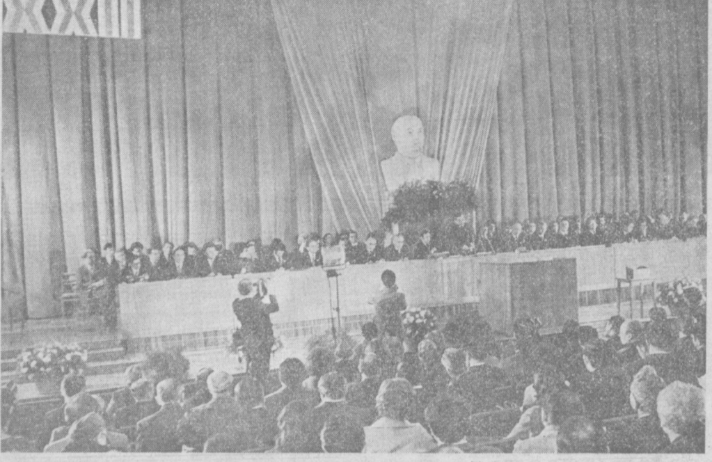
НА СНИМКЕ: в зале заседаний XXII Ташкентской городской партийной конференции.