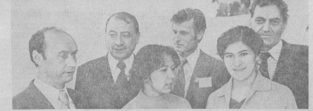
НА СНИМКЕ: группа делегатов конференции.