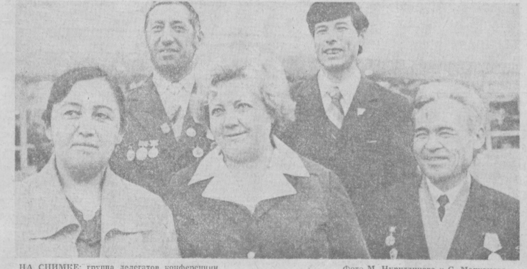
НА СНИМКЕ: группа делегатов конференции.