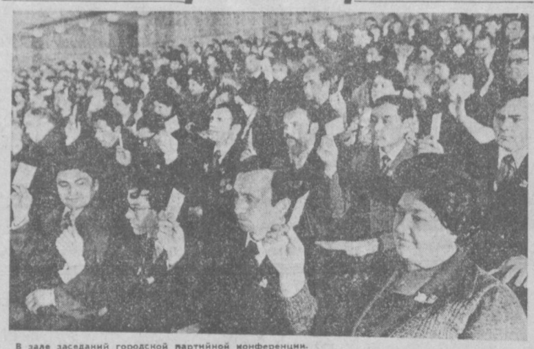
В зале заседаний городской партийной конференции.