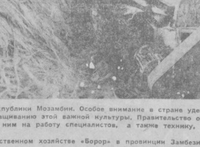
Сизаль — одна из основных экспортных культур Народной Республики Мозамбик. Особое внимание в стране уделяется созданию государственных и кооперативных хозяйств по выращиванию этой важной культуры. Правительство оказывает большую помощь крестьянским объединениям, направляя к ним на работу специалистов, а также технику, семена и удобрения.