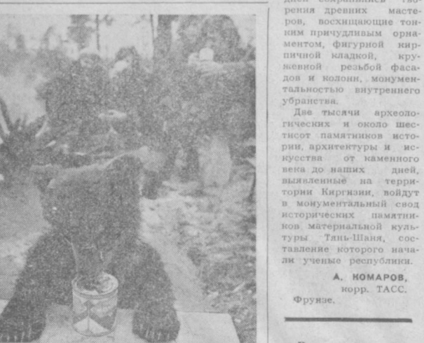
Сластена медвежьим Вина.