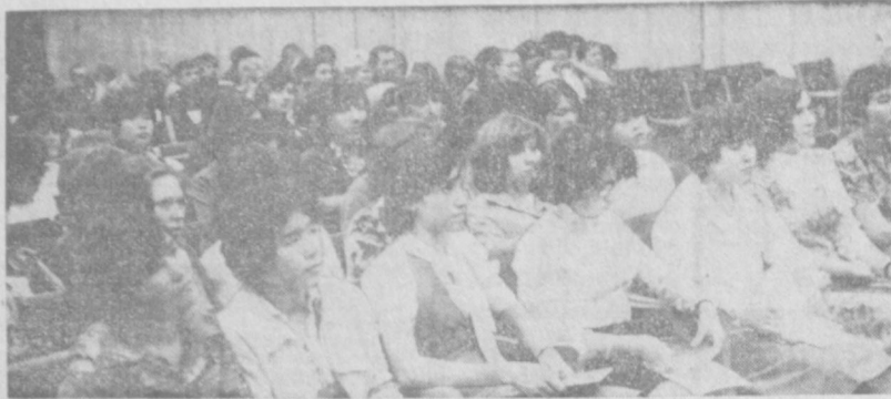
• Рабочая смена—наша забота