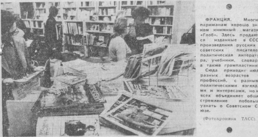
Многие парижане хорошо знают «Глоб». Здесь продаются издания в СССР произведений русских и советских писателей, политическая литература, учебники, словари, а также грамматика. Сюда приходят люди разных возрастов и профессий, с разными политическими взглядами и интересами, но всех объединяет общее стремление больше узнать о Советском Союзе.

На днях в Ташкенте открывается Декада книги Чехословацкой Республики, посвященная национальному празднику чехов и словаков — четверть века. Книжки авторов Чехословакии занимают одно из ведущих мест среди общего количества изданий зарубежной литературы в нашей стране. Популярны в Узбекистане произведения Я. Гашека, Ю. Фучика, К. Чапека, М. Пуймановой, Б. Немцовой, М. Майеровой, И. Ольбрахта, П. Илемничского, Яна Неруды, Вл. Минача и многих других. Со многими их произведений знакомы и читатели нашей страны. Многие парижане хорошо знают «Глоб». Здесь продаются издания в СССР произведений русских и советских писателей, политическая литература, учебники, словари, а также грамматика. Сюда приходят люди разных возрастов и профессий, с разными политическими взглядами и интересами, но всех объединяет общее стремление больше узнать о Советском Союзе.