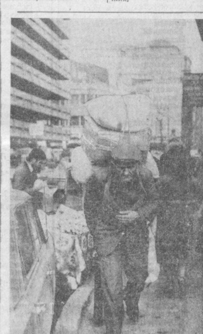
Нелегон труд стамбульского неспасания. Но это познаний человек рад и такой работе. Везрабница — одна из социальных проблем Турции. По официальным данным, в стране насчитывается свыше 2 миллионов безработных. Если же учесть спиртное безработицу, существующую в сельских районах, то число лишних людей составит около 4 миллионов человек.

БЕРЛИН. На пять тысяч километров увеличилась протяженность автобусных линий ГДР за прошедшие пять лет. Сейчас они охватывают 97 проц. всех городов и сел республики. Эти данные достаточно убедительно показывают, какую роль в стране играет автомобильный транспорт в пассажирских перевозках.