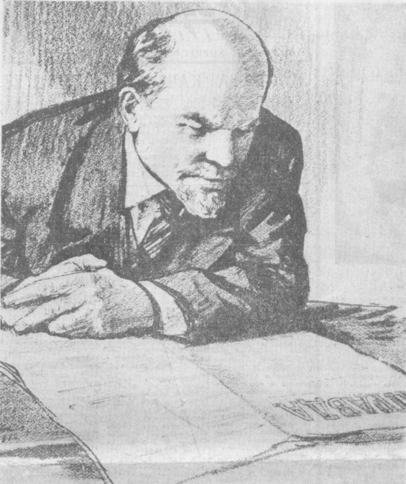
Рисунок Н. Жукова.