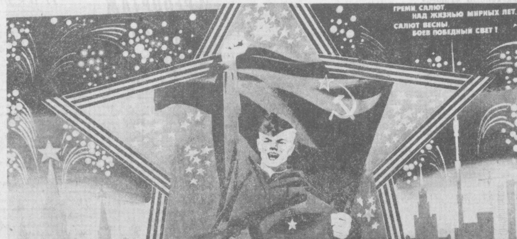
Планет художника В. Сачнова. Издательство «Планет».