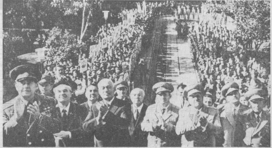
Момент торжественного открытия памятника Ю. А. Гагарину.