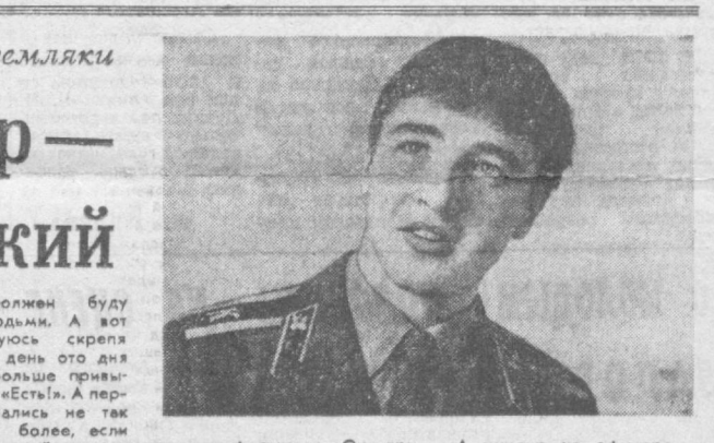
Каждому из нас приходится работать в условиях жесткой конкуренции. Но это не повод для отчаяния. Главное — характер — комсомольский.

Тем же секретарем успеха комсомольской организации! Наверное, в сплоченности, активности, абсолютной готовности молодежи, в том, что каждая ценная инициатива находит широкую поддержку в коллективе.