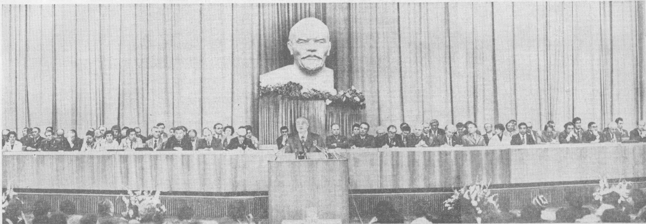
ТАШКЕНТ, 22 мая. На Всесоюзной научно-теоретической конференции.

Желаю вам плодотворной работы. Л. БРЕЖНЕВ