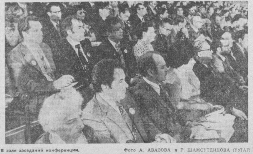
В зале заседаний конференции.