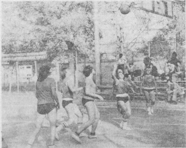
На стадионе «Мехнат» регулярно проводят свои тренировки участники секций по различным видам спорта — работниками близлежащих промышленных предприятий и организаций. НА СНИМКЕ: идет очередная товарищеская встреча.