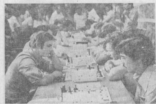
В субботу и воскресенье, сотни любителей шахмат принимают участие в батальных, которые разгораются в парке культуры и отдыха имени М. Горького.

В кинотеатрах Ташкента — имени 50-летия Ташсвета, имени 25-летия Узбекской ССР, «Гунча», «Нукус» — начался тематический показ художественных и документальных фильмов.