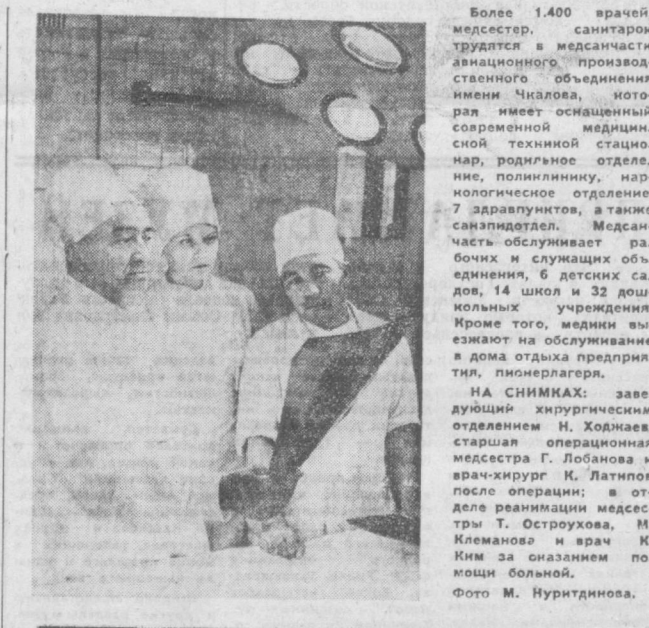
Более 1400 врачей, медсестер, санитаров трудятся в медчасти авиационного производственного объединения имени Чапаева, которая имеет оснащенный современной техникой стационар, родильное отделение, поликлинику, наркологию, дерматологию, 7 здравпунктов, а также санэпидотдел. Медсестры обслуживают рабочих и служащих объединения, 6 детских садов, 14 школ и 32 дошкольных учреждения. Кроме того, медики выезжают на обслуживание в дома отдыха предприятий, пионерлагеря.

День медицинского работника — праздник представителей самой гуманной профессии — врачей, сестер, санитаров, фельдшеров. Медицина в нашей стране всецело служит интересам народа. Советский Союз — первая страна в мире, где последовательно проводятся в жизнь социалистические принципы здравоохранения: бесплатность, доступность квалифицированной медицинской помощи и широкая профилактика заболеваний. Успехи нашей отечественной медицины общезвестны. И чем значительнее они, тем меньше белых пятен остается на фронте борьбы за здоровье людей, тем дальше уходят от нас те далекие времена, когда Туркестан, а с ним и наш Ташкент страдали от повальных эпидемий и жестоких заболеваний, спасения от которых казалось, никогда не найти. Особенно страшным бичом для населения были аскариоз, дизентерия, малярия, кожный лейшманиоз, оспа, рожа, бугорчатка легких и другие. Нижайшая организационная борьба с этим злом в дореволюционном Туркестане не велась, и поэтому смертность и заболеваемость были очень высоки. Обратимся к фактам.