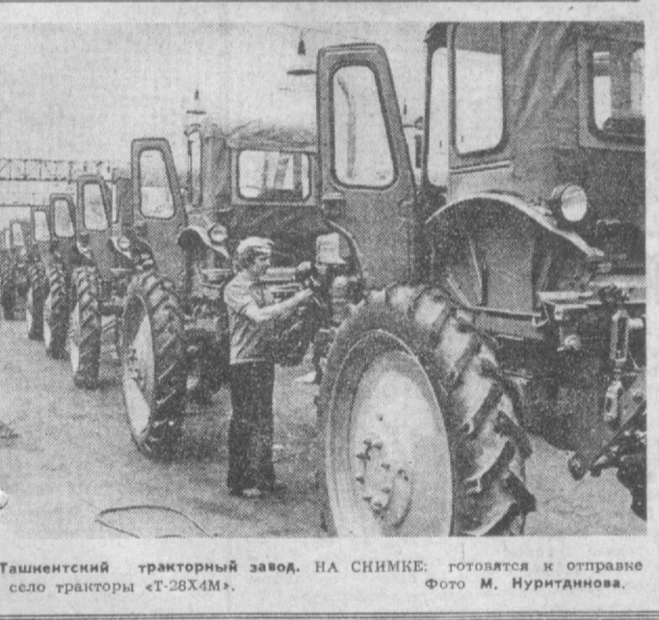
Ташкентский тракторный завод. НА СНИМКЕ: готовятся к отправке на село тракторы «Т-28Х4М».