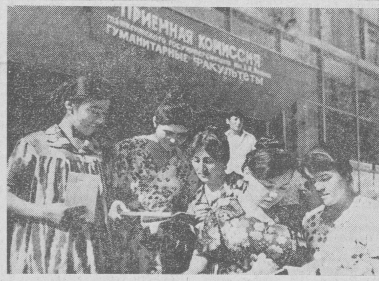
НА СНИМКЕ: группа абитуриентов Ташкентского государственного университета.

Сколько в нынешнем году юношей и девушек после успешной сдачи экзаменов получат право поступления в многочисленные студенческие вузы? — Только на дневную форму обучения в нынешнем году будет принято свыше 32 тысяч тех, кто мечтает овладеть вершинами науки.