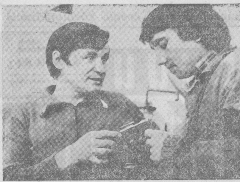
Рабочая смена — наша забота

По итогам социалистического соревнования за второй квартал победителем признан Октябрьский район.