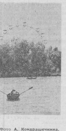
В парке Победы.

Около ста человек после трудовой недели выезжают за город. До тысячи работников объединения побывают летом в домах отдыха, санаториях, совершат путешествия по туристическим путевкам. Около семисот человек посетят заводской профилакторий. В результате только