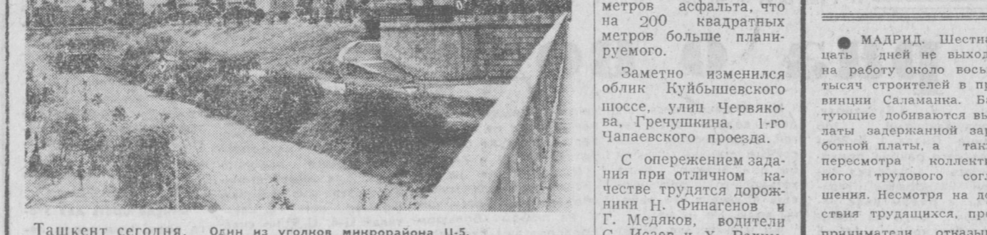
Ташкент сегодня. Один из уголков микрорайона Ц-5.

Хороших успехов добиваются из месяца в месяц благоустроители Ленинского района. Не был исключением и июль. Дорожные работы уложили за месяц 2.500 квадратных метров асфальта, что на 200 квадратных метров больше планируемого.