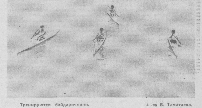
Тренируются байдарочники.