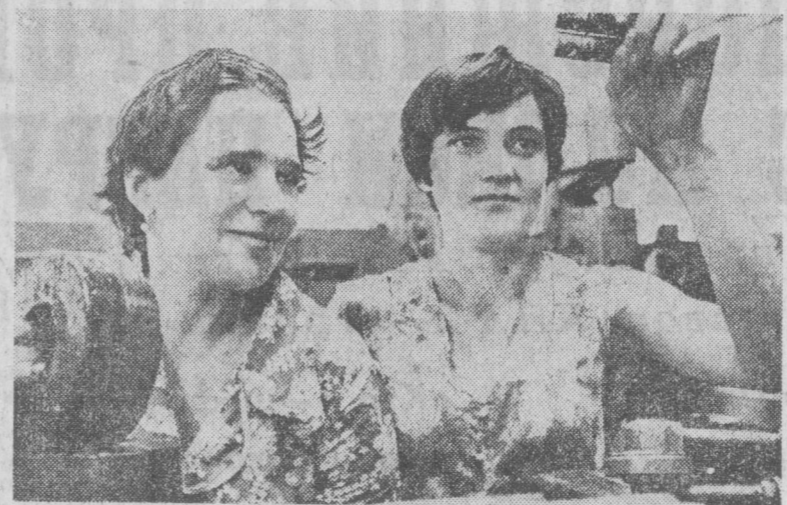
Годовое задание—досрочно! — под таким девизом трудится сегодня коллектив Ташкентского агрегатного завода. За семь месяцев им изготовлено дополнительной продукции на 120 тысяч рублей...