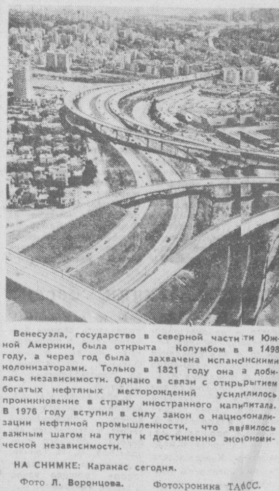
Венесуэла, государство в северной части Южной Америки, была открыта Колумбом в 1498 году, а через год была захвачена испанскими колонизаторами. Только в 1821 году она добилась независимости. Однако в связи с открытием богатых нефтяных месторождений усилилось проникновение в страну иностранного капитала. В 1976 году вступил в силу закон о национализации нефтяной промышленности, что явилось важным шагом на пути к достижению экономической независимости. НА СНИМКЕ: Каранас сегодня.

период возникает проблема водоснабжения. Можно даже утверждать, что с каждым годом она становится все сложнее. А решать ее надо. Один из путей — повсеместный ввод в эксплуатацию напорного технического водопровода. Для нашей столицы это не новинка. Примеры есть. На кварталах Ц-4, Ц-5, на сквере Революции, в аэропорту все зеленые насаждения поливаются водой из технического водопровода. Поэтому жители близлежащих домов не «водной проблемы». Однако таких примеров все еще не много. В дальнейшем, разумеется, потребуются немалые капитальные затраты, чтобы технический водопровод был повсеместно. Но они оправдают себя, ибо Ташкент — город высокого температурного режима, что само по себе требует специфического подхода к вопросу водоснабжения. Ежегодно вводится в эксплуатацию новые дома, целые жилые массивы. Новоселы начина-