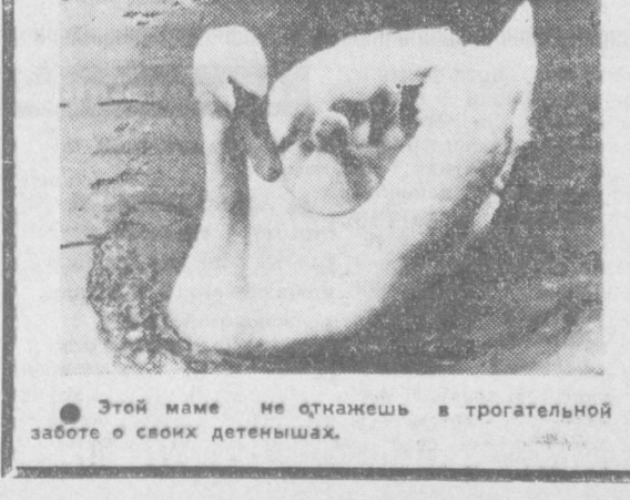
Этой маме не откажешь в трогательной заботе о своих детенышах.

«Ни в одной развитой стране мира не обстоит так плохо дела с жильем, как в Японии», — безрадостно констатирует «Дейли номур». Простые японцы живут, как правило, в тесных помещениях, лишённых элементарных бытовых удобств. Впрочем, что им остается делать, если как обстоит дело японцев, газета «Дэйли таймс» даже домыслила в пригороде столицы не менее десяти миллионов японцев. Каждый третий из них, кто покупает такой крошечный домик, обречен, чтобы расплатиться с долгом, вложить до конца дней своих жалкое существование.