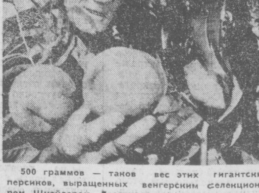
500 граммов — таков вес этих гигантских перелетов, выращенных венгерским селекционером Шнейдером. Десятилетнее дерево дало в этом году 40 тысяч плодов.

ДАР-ЭС-СЛАМ. Итоги научных изысканий, проводимых таджикскими энтомологами в сотрудничестве с зарубежными учеными, вселяют надежды на успех в борьбе с африканской мухой цеце — разносторонним опасным заболеванием человека и домашних животных. В течение ряда лет на северо-востоке Танзании в полых условиях испытываются различные способы уничтожения этой опасной насекомого. Наиболее эффективным, экономичным и совершенно безвредным для окружающей среды оказался метод стерилизации. Он заключается в том, что выращенных в лабораторных условиях