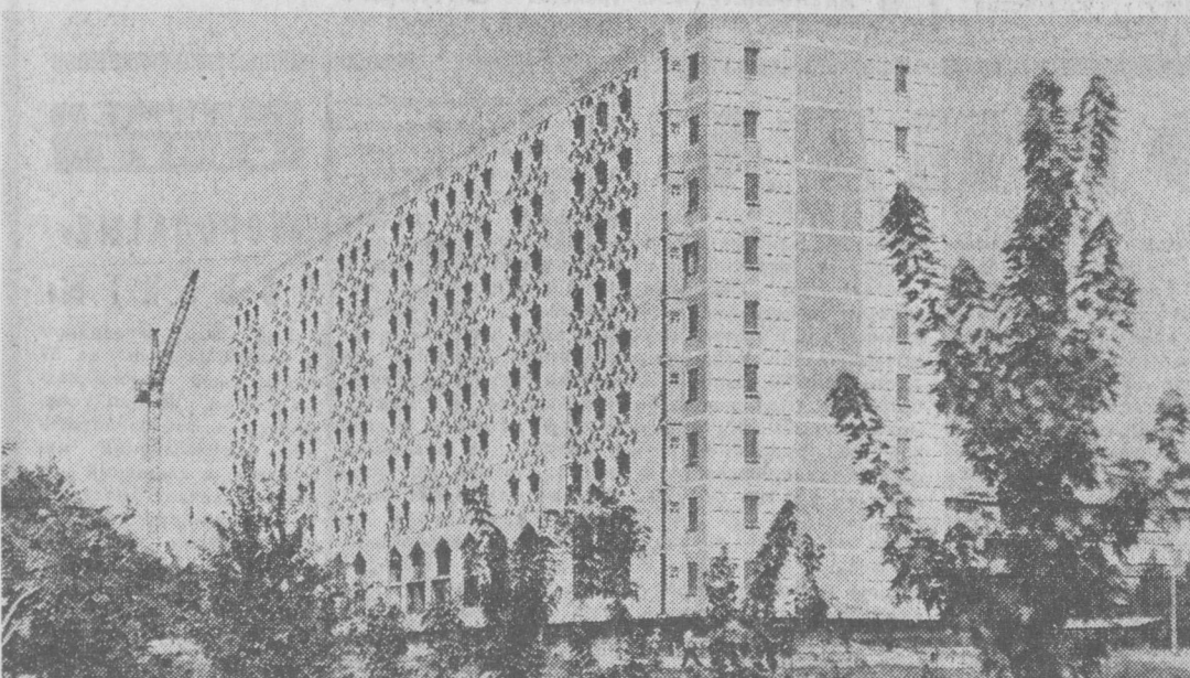
ТАШКЕНТ СЕГОДНЯ. Новый жилой дом на массиве Юнусабад по улице А. Даниша.

В решении задач подготовки рабочих училищ будет способствовать открытие Ташкентского института повышения квалификации работников системы профессионально-технического образования. В формировании молодых рабочих, в улучшении их профессиональной подготовки большое значение имеет производственная практика учащихся на базовых предприятиях. Эффективно проходит она на швейных объединениях «Красная заря» и имени 50-летия Узбекской ССР и Компартии республик, авиационном производственном объединении имени Чкалова, подразделениях Главташкентстрой и т. д.