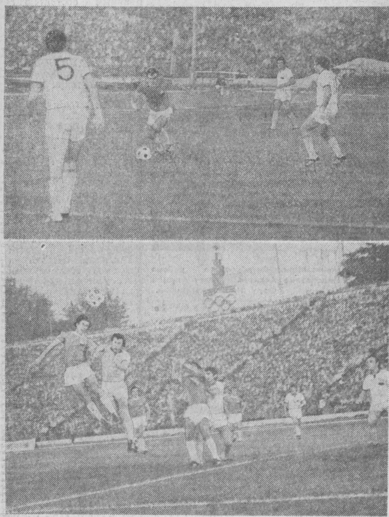
НА СНИМКАХ: моменты встречи.

Шалвович Асатиани: — Что поделалось, в футболе такое бывает. Сегодняшняя победа «Пахтакора» — еще одно убедительное свидетельство в пользу того, что порой пол, мобильность, искусство команды многое значат в борьбе с самым именитым, имеющим в своем составе игроков высокого класса соперником. Новый «Пахтакор» в этом смысле