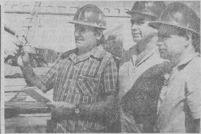
На магистралях столицы