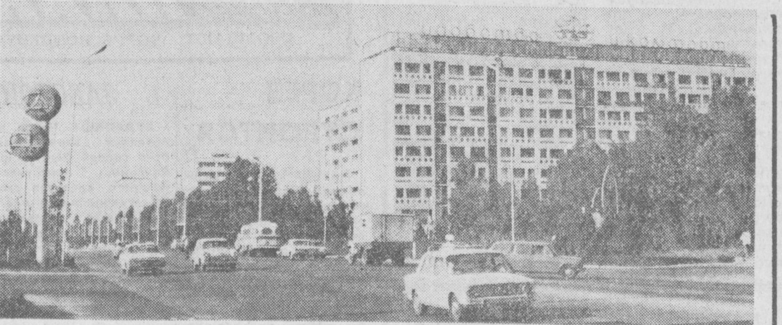
ТАШКЕНТ СЕГОДНЯ. НА СНИМКЕ: вид на проспект Ленина.

Итоги серии совещаний министров стран — членов «Общего рынка», проведенных в последние дни в Брюсселе, в очередной раз свидетельствуют о глубине противоречий внутри «девятки» и остроте проблем, которые стоят перед ЕСЗ в целом и перед каждым членом сообщества — в отдельности. Валютные трудности западноевропейских государств стали предметом обсуждения на совещании министров финансов, которые озабочены единодушными лишь в одном: признали, что нынешняя «эко-