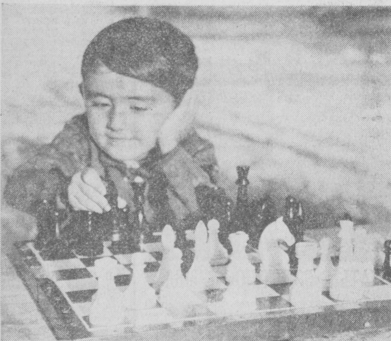
Юный шахматист.