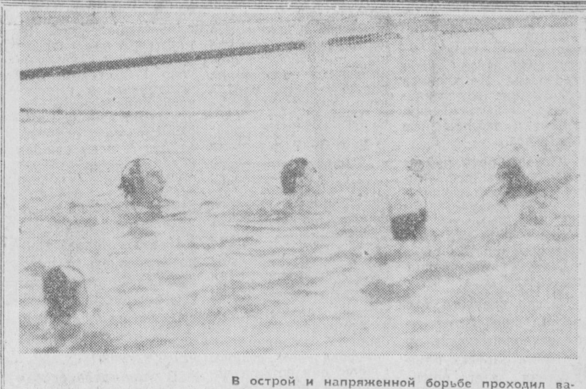
В острой и напряженной борьбе проходил ватерпольный турнир спартакиады.

С начала турнира определились лидеры — команды Фрунзенского, Ленинского и Хамзинского районов, которые были значительное сильнее других. К этой «большой тройке» с известными оговорками можно причислить команду Чиланзарского района. В составах этих команд, как говорится, знакомые все были лица — воспитанники одного и того же бассейна «Текстильщик». С одной стороны, вроде неплохо, что этих игроков хвятило на четыре команды. Но, с другой, где же отдача других бассейнов города? В общем, повторю, турнир удался. В ходе его тренировки и специалисты смогли еще раз проверить силы своих воспитанников, выявить все городские резервы.