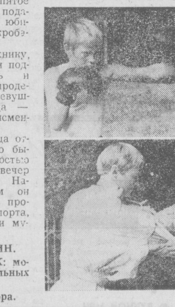
В. СИНЯКИН. НА СНИМКАХ: моменты показательных выступлений. Фото автора.

В начале мая нынешнего года началось заседание жильцов дома № 1 на массиве Карасу-3. За прошедшие 5 месяцев новоселья в новых домах справили еще десятки семей ташкентцев. Но, увы, на массиве до сих пор нет элементарных бытовых удобств. Например, дома подключены к временному электрическому кабелю, который снабжает электроэнергией строителей. У жильцов же в квартирах свет ежедневно отключается на 8 и более часов. Во многих домах, в частности, в нашем, отсутствуют горячая вода. Сразу же за домом образовалась свалка из «лишнего» сборного железобетона и мусора. А ведь рядом расположены хлебный и овощной магазины. Не за горами зима, а внутриквартирные дороги и тротуары еще не благоустроены. Кругом пыль, антисанитария. Жители массива настойчиво напоминают о своих нуждах руководителям ЖЭК, управления благоустройства и исполкома Куйбышевского райовства. Во всех инстанциях нас обнаддевают, утешают, но конкретных мер к устранению недостатков не принимают. Жильцы дома № 1 массива Карасу-3 (всего 30 подписей).