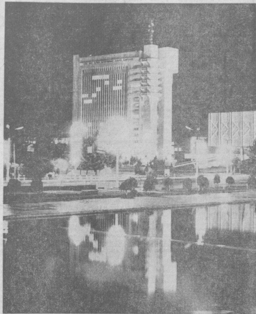
Далеко за полночь, но по-прежнему светятся окна редакционно-издательского корпуса. Готовятся к выпуску утренние газеты.