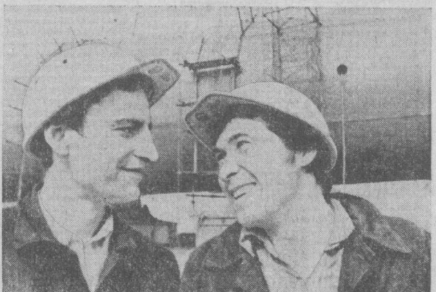
По улице Зигельса возводится новая телевизионная башня высотой 350 метров. Этот уникальный объект сооружают коллективы треста «Высотстрой-11» и механизированной колонны треста «Сибстальконструкция».