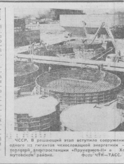
СССР. В горах этот этап вступило сооружение одного из гигантов часовой энергетики термоядерной электростанции «Прунерво-11» в Хо- мудовском районе.

УЛАН-БАТОР. Бо- лее 4,5 тысячи чело- век отдохнули в нача- ле года в санатории «Жанчилин», создан- ном на базе известных не только в республи- ке, но и далеко за ее пределами минераль- ных источников. В на- стоящее время этот санаторий по праву считается лучшим в народной Монголии. Из года в год ук- репляется и расширя- ется лечебно-диагно- стическая база «Жан- чилина». Вырастают новые корпуса, благо- устраиваются старые, лечебные и процедур- ные кабинеты, осна- щаются самым современ- ным оборудованием. Большую помощь монгольским медикам