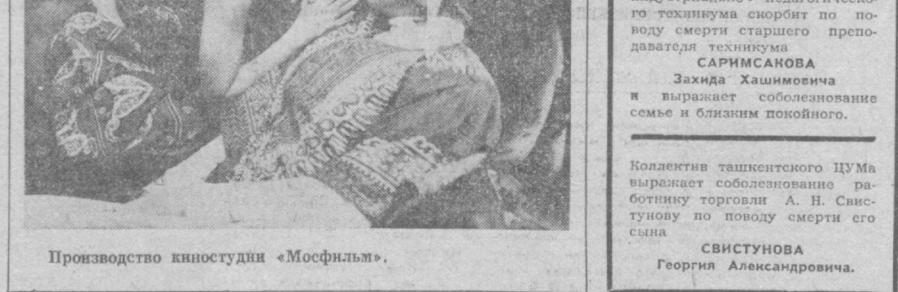
Производство киностудии «Мосфильм».