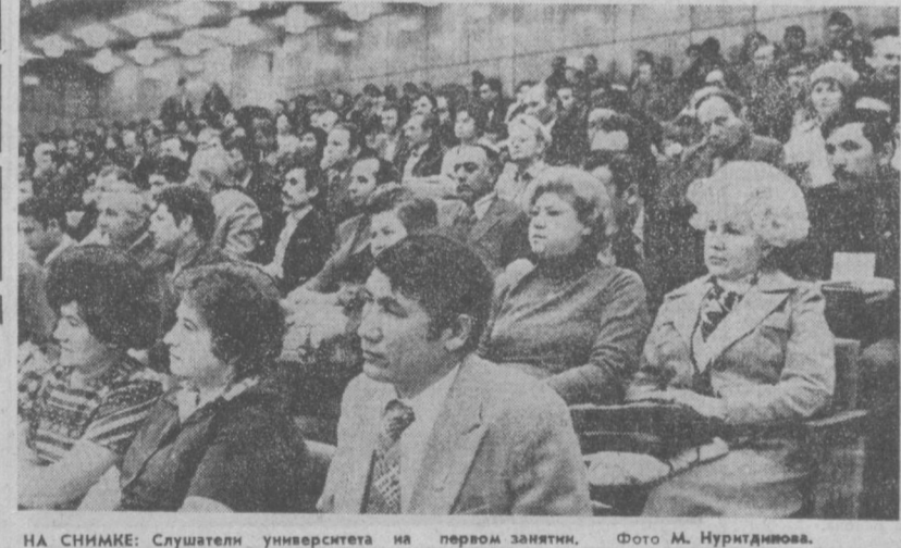
НА СНИМКЕ: Слушатели университета на первом занятии.