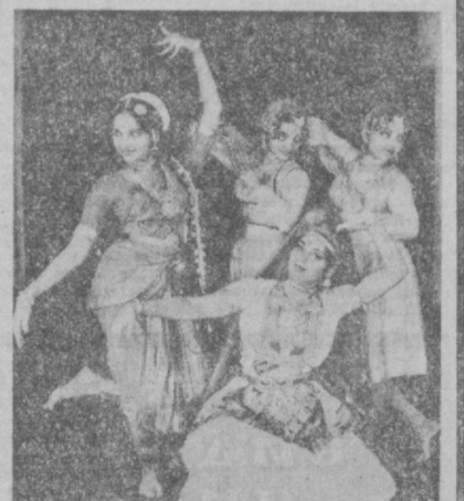
Богатое и самобытное танцевальное искусство Индии пользуется неизменным успехом у зрителей во всех уголках мира. НА СНИМКЕ: индийские танцовщицы.

Первые шаги сделаны и в создании промышленной базы. В частности, строятся предприятия по производству строительных материалов и переработке сырья. Укрепляя национальную экономику, подчеркнул министр, правительство Сейшейл будет заботиться об улучшении социальных условий населения. Ширится жилищное строительство, улучшается система образования и медицинского обслуживания. В начале 1980 года в стране намечено ввести 9-летнее всеобщее бесплатное образование. В наших планах — сделать бесплатным и медицинское обслуживание.