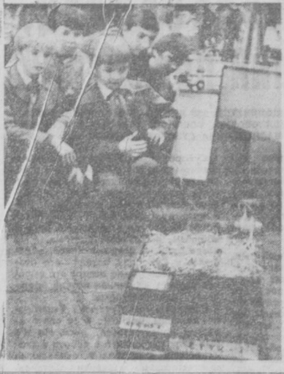
«Техническое творчество молодых талантов — научно-техническому прогрессу нашей Родины» — под таким девизом проводится в Думе техники республиканская выставка технического творчества учащейся молодежи. Здесь представлено более 300 моделей, макетов машин, самолетов, ракет, кораблей, а также приборов, станков, многие из которых — действующие.