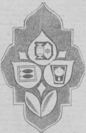
ПЯТНИЦА — 23 НОЯБРЯ

Главного управления торговли Ташгорисполкома.