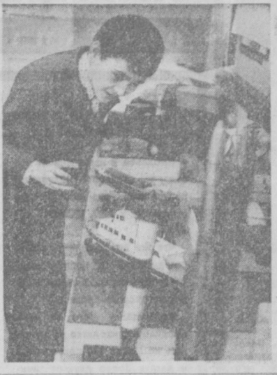
«Техническое творчество молодых талантов — научно-техническому прогрессу нашей Родины» — под таким девизом проводится в Думе техники республиканская выставка технического творчества учащейся молодежи. Здесь представлено более 300 моделей, макетов машин, самолетов, ракет, кораблей, а также приборов, станков, многие из которых — действующие.

«Настоящий коммунизм может иметь успех пока только на Западе, однако ведь Запад живет за счет Востока: европейские империализм славным образом на восточных колониях, но они в то же время вооружают и обучают свои колонии, как сражаться, и этим Запад сам рвет себе аму на Востоке». Настольно точен и ясен стиль и смысл, что мелькнула мысль: не стенографировал ли Фусс беседу? (Окончание следует)