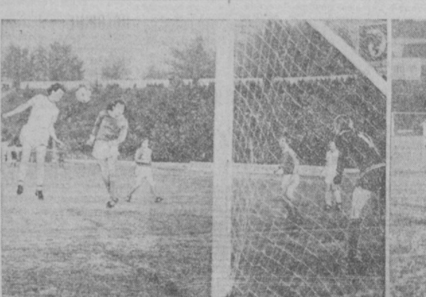
НА СНИМКАХ: моменты встречи.