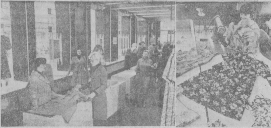
Полное удовлетворение спрос населения на высококачественные текстильные изделия позволяет содружеству производственного швейного объединения «Ригас лудзис», швейного объединения «Ригас алтерс», Дома моделей столицы Латвии и фирменного магазина «Лотос».