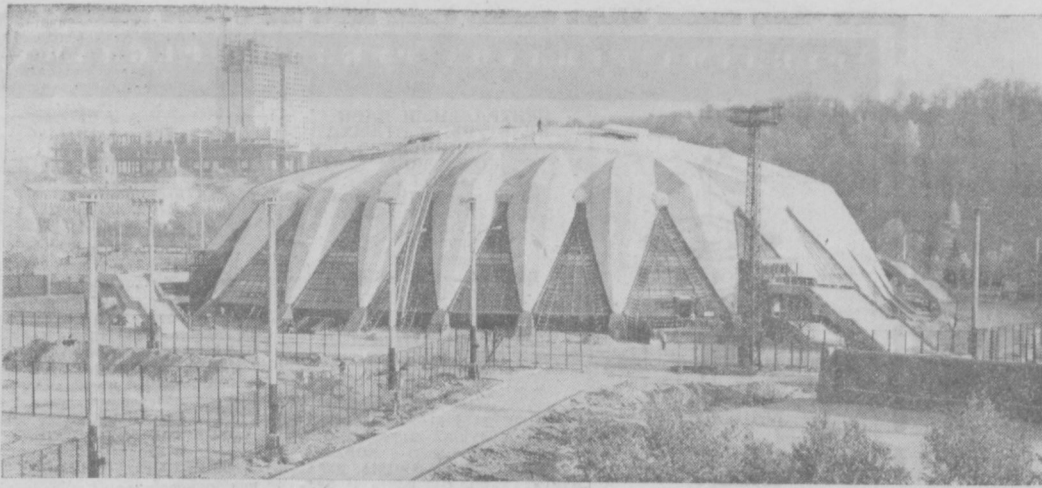
МОСКВА. Завершена реконструкция всех спортивных сооружений Центрального стадиона имени В. И. Ленина, где пройдут церемония открытия и закрытия Игр XXII Олимпиады, состязания по нескольким видам спорта. На территории главного стадиона страны построен еще один дворец спорта — крытый зал «Дружба», который прошел серьезный экзамен во время VII летней Спартакиады народов СССР — в нем проходили соревнования волейболистов. НА СНИМКЕ: Дворец спорта «Дружба».