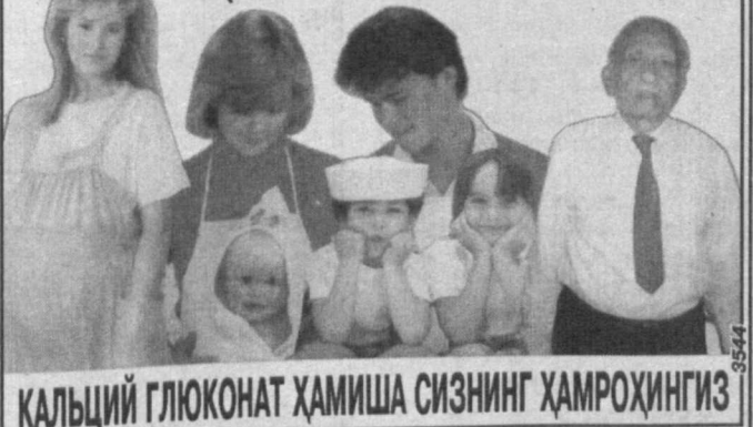
КАЛЬЦИЙ ГЛЮКОНАТ ҲАМИША СИЗНИНГ ҲАМРОҲИНГИЗ

Шунингдек, Президентимиз асарларида тилга олинган ички таҳдид кўринишлари элнинг кенг ва очик-ойдин таҳдид қилиб берилса, бундай онглиликнинг тараққиёт учун фойдаси беададир. Масалан, экологик онгли-